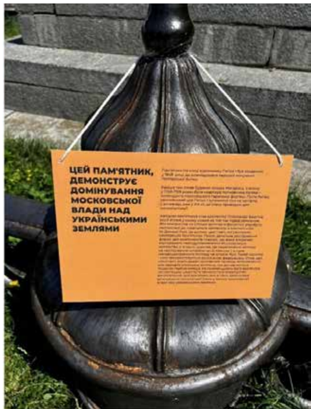
Рис. 2. Маскування пам'ятника на місці відпочинку Петра I у м. Полтава